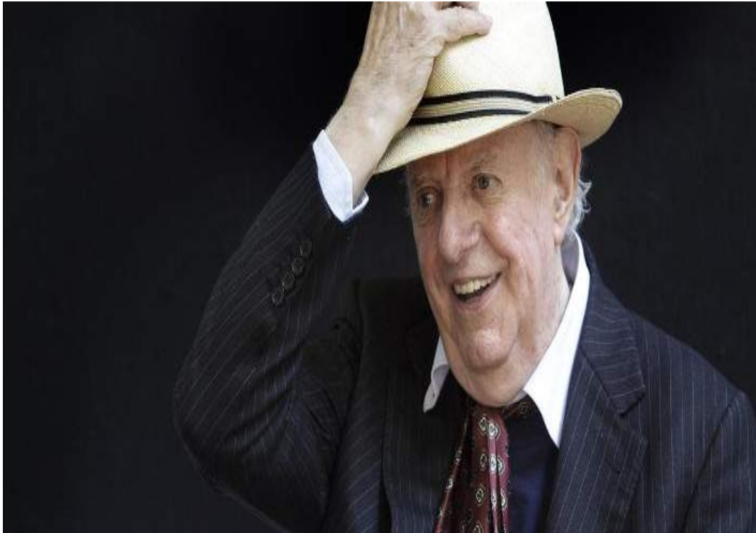
Πέθανε ο σκηνοθέτης, ηθοποιός και λογοτέχνης Ντάριο Φο.

Ο βραβευμένος με Νόμπελ Λογοτεχνίας το 1997, αγαπημένος θεατρικός συγγραφέας, «έφυγε» απο τη ζωή σε ηλικία 90 ετών. «Είχα υπερβολική τύχη στη ζωή μου. Όλα όσα πήγαιναν στραβά, οι κρίσεις, οι καταστροφικές στιγμές ανατρέπονταν πάντα » έλεγε. «